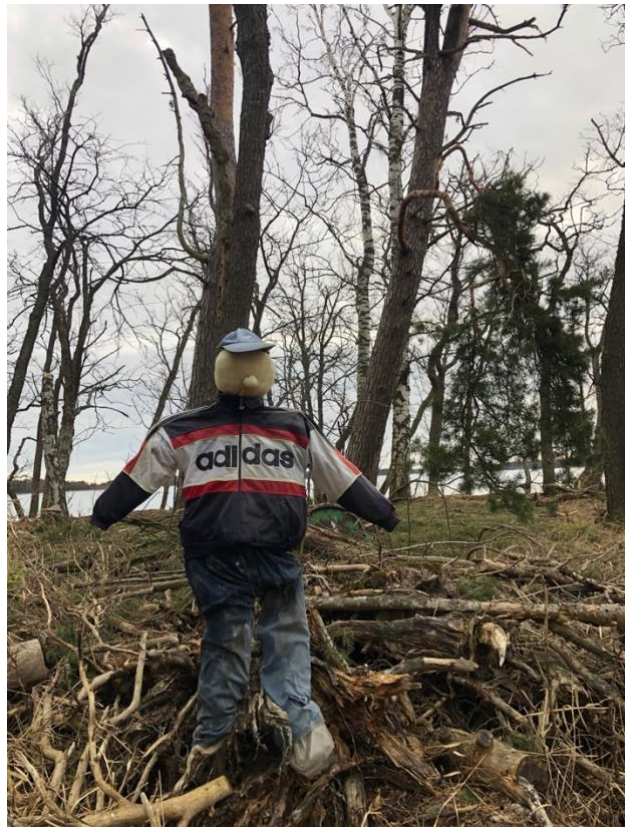
Kuva: Perinteinen linnunpelätti ehkäisee yhdyskuntien syntymistä

Keväällä kun merimetsot saapuvat alueelle estettiin uusien yhdyskuntien syntyminen. Merimetsojen torjunnassa keväällä on avainasemassa tehokas pesintäyryitysten tarkkailu. Pesä syntyy linnuilta nopeasti ja munapesän poistaminen oli lupaehdoissa kielletty. Pesät, joihin ei oltu ehtä munia, poistettiin. Useimmissa tapauksissa riitti pesintää suunnittelevien merimetsojen häirintä ja paikalle jätetty karkotin tai pelotin. Jo rakennettujen pesien poistamiseen jouduttiin turvautumaan hankealueella vain kahdesti Uudenkaupungin edustalla. Kohteeseen jätetty linnunpelätti (haalarimies, scaery-man) sekä lähetävä riistakamera ehkäisi uusintapesintäyryitykset ja tilannetta seurattiin etänä. Linnunpelättimistä valtaosa saatiin lahjoituksena tekijältä Uudenkaupungin kaupungintalon edustalta puretusta taideteoksesta missä oli noin 100 erilaista ihmishahmoa. Hankeaikana alueelle ei syntynyt yhtään uutta merimetsöyhdyskuntaa.